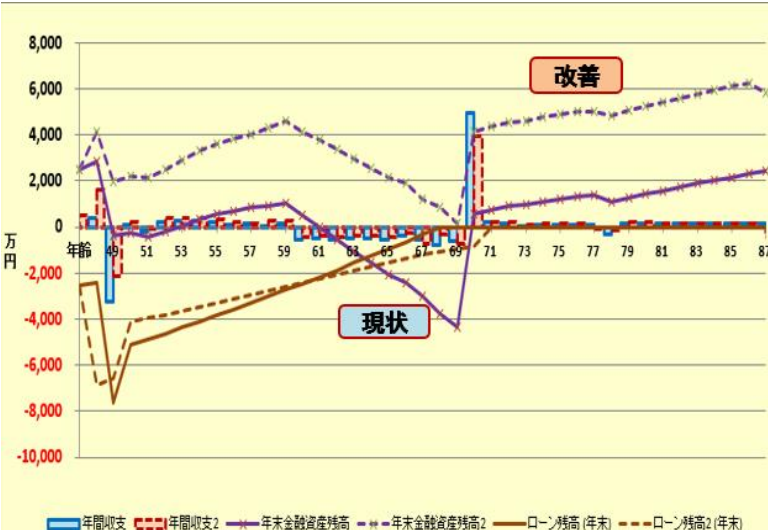
必要保障額の比較チャート